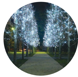
学びの森プロムナードイルミネーション