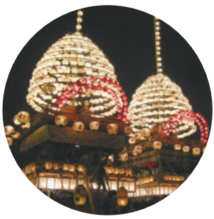
かわしま川まつり