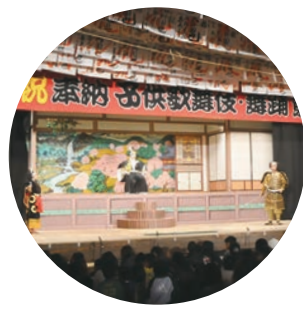
村国座子供歌舞伎