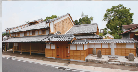
格式ある江戸時代の旅籠を現代に再現「脇本陣」