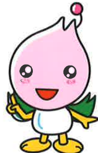
各務原市マスコット キャラクター ららら

車 中部国際空港から岐阜各務原 IC 車で80分 (104km) です。 高山から岐阜各務原 IC まで 車で90分 (120km) です。